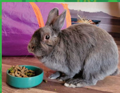
Cendrillon · Lapin nain grise · Femelle · 3 ans ½

Duo d'inséparables version lapin. Curieux et agréables à vivre. Ils sont indissociables. La preuve que ces adorables créatures sont grégaires ! Alors n'attendez plus, ces deux lapins seront ravis de retrouver la liberté d'un foyer... Ensemble.