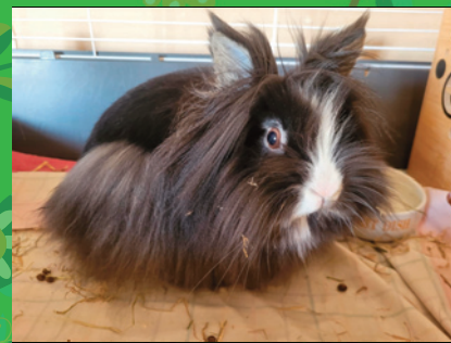
Laly · Lapin nain croisé tête de lion noire et blanche · Femelle · 2 ans

Cendrillon est une petite lapine très gentille, qui se laisse approcher sans difficulté.