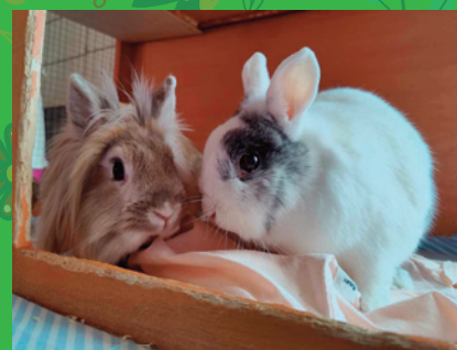
Nala et Mayla : Lapin tête de lion · Femelle 4 an · rouse/ Lapin nain · Mâle 4 ans · blanc et noir