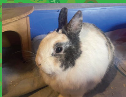
Neslé · Lapin nain · Mâle 1 an · Tricolore

À croquer, mais pas en compote, cette petite bouille timide saura séduire les lapin-parents les plus sensibles. Venez la rencontrer, venez cueillir notre délicieuse pomme de reinette !