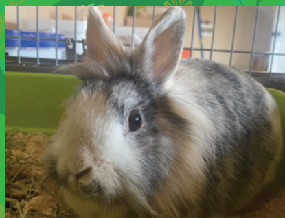
Pomme · Lapin tête de lion · Femelle · 6 ans · tricolore

Alors si vous cherchez un compagnon à longues oreilles, ou si vous connaissez quelqu'un qui aimerait en adopter, n'hésitez pas à nous contacter !